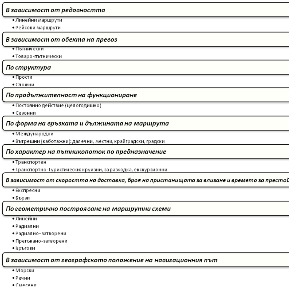
Фиг. 3. Класификация на пътнически маршрути. Забележка: Фиг. 3 е композирана по данни от източници [3].

Според геометричното построение на схемите на маршрута се различават девет типа. Линейният маршрут започва от едно пристанище и завършва от друго; при радиално - предвижването се извършва от едно базово пристанище в различни посоки и обратно към базовото пристанище. Радиално-затвореният маршрут съчетава линеен маршрут в права и обратна посока. Прегъвано-затвореният маршрут започва и завършва в едно и също базово пристанище, но междинните пристанища не са разположени според географската ротация. Кръговият - започва и завършва в едно и също основно пристанище, а междинните пристанища са разположени според географската ротация. Крайградският маршрут е положен между пристанищата или пунктовете в крайградските зони (той може също така да свързва градските пунктове с крайградските), градският - между пунктовете в рамките на един град. Резултатите от изследването на тази класификация са отразени на фигура 3.